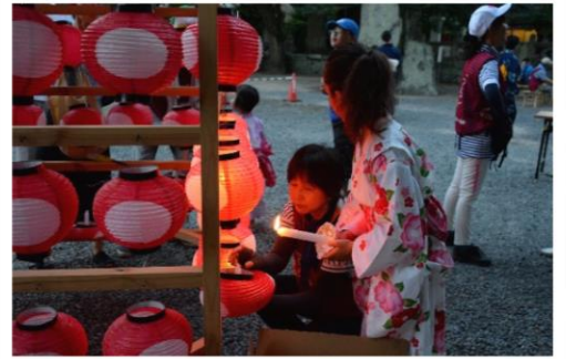
八坂神社火入れの様子 (2018年)