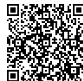
▲去年の様子 QRコードからメール送信