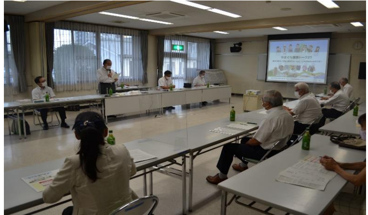
▲昨年の車座トークの様子