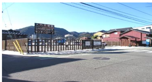
▲八坂神社前観光専用駐車場

直近で整備した八坂神社向かいの広場（駐車場）には板塀や休憩所に天然木を使用した。一の坂多目的広場については、主として天然芝を使用するなど、風情をより大事にして整備する。