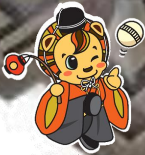
大殿地域ご当地しノ丸