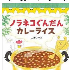
ノラネコぐんだん カレーライス (工藤 ノリコ)