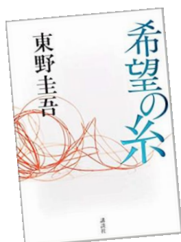
希望の糸 (東野 圭吾)